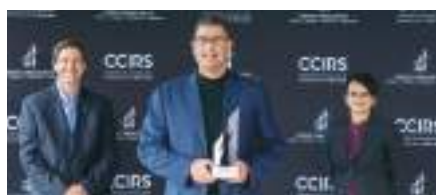
Entreprise manufacturière ou de distribution moins de 10 M $ : Métaux Solutions inc.