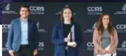
Commerce de détail : Cycle Néron