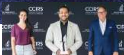
Nouvelle entreprise : Nabu Pro