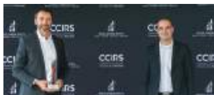
Prix Développement Durable : Legault-Dubois inc.