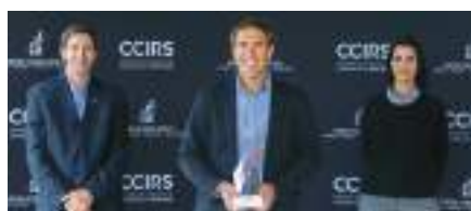
Entreprise manufacturière ou de distribution de 10 M $ et plus : RefPlus inc.