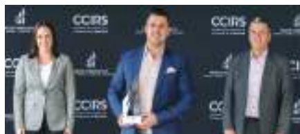
Prix Coup de cœur : La Boîte C