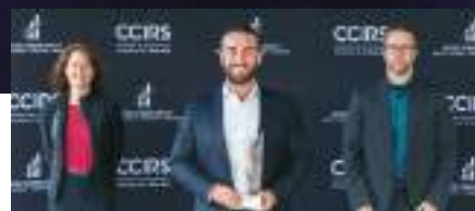
Relève et transfert d'entreprise : Aquatech BM