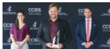
Entreprise de service de 20 employés et plus : Chrono Jet