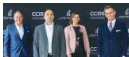
Bourse Aile Jeunesse : ARIV