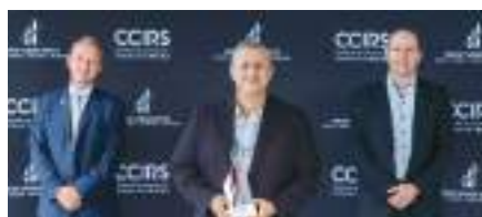
Entreprise de service moins de 20 employés : Arium design inc.