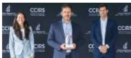
Entrepreneurs et métiers de la construction : Bisson Expert