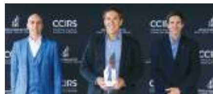
Entreprise de l'année : RefPlus inc.