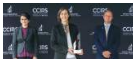
Exportation : Creos experts-conseils inc.