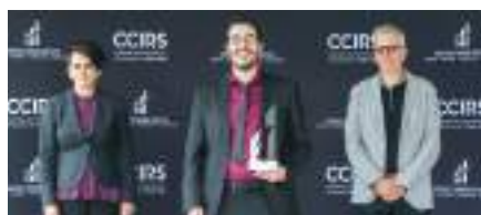
Innovation et technologies : Dyze Design